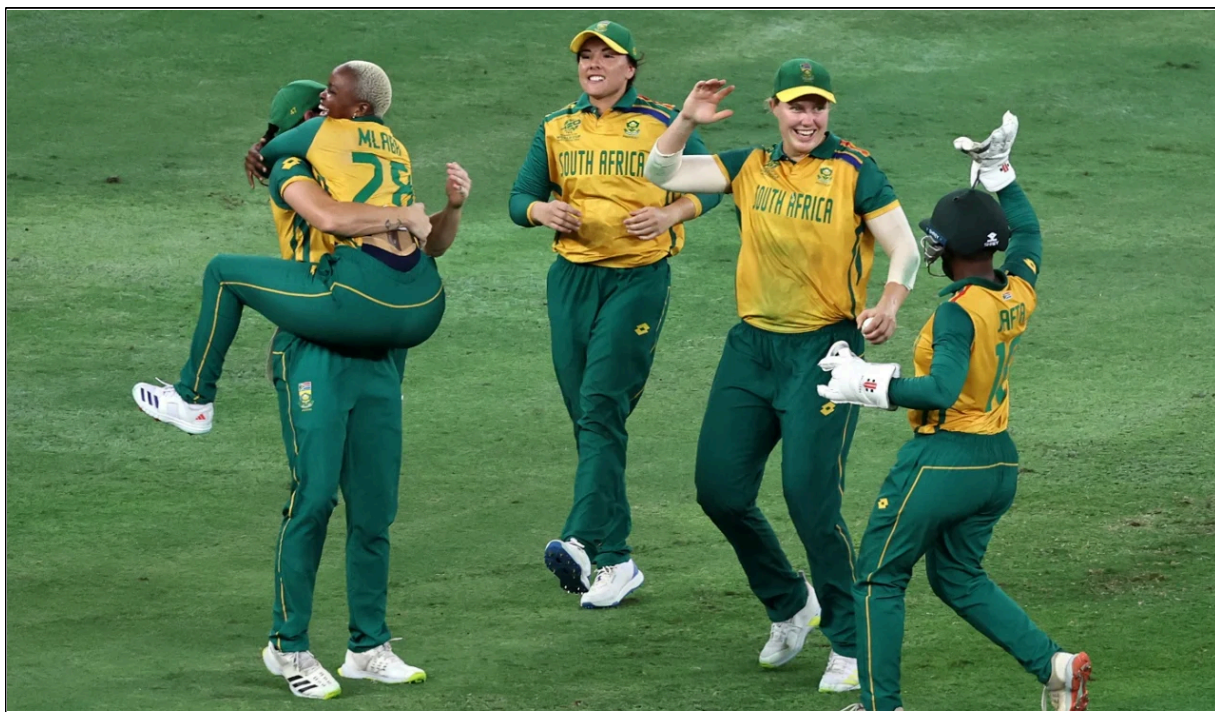
শক্তিশালী অষ্ট্ৰেলিয়াক পৰাভূত কৰি ফাইনেলত প্ৰৱেশৰ পিছতে দক্ষিণ আফ্ৰিকাৰ খেলুৱৈসকলৰ উল্লাস