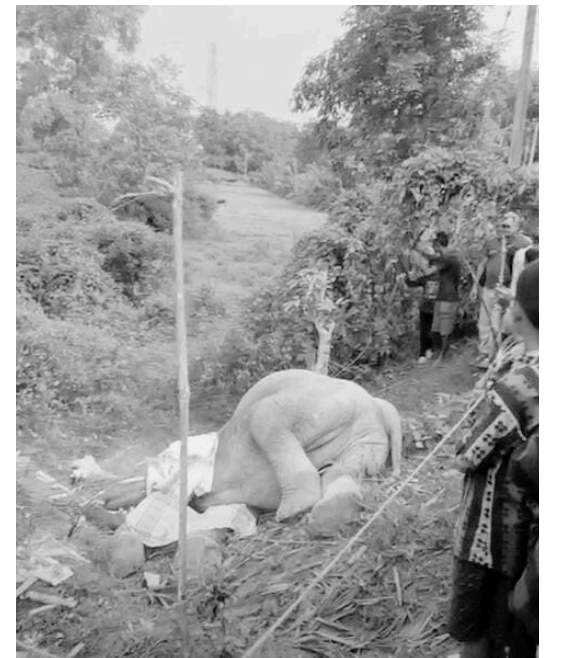
মৰণীত এসপ্তাহৰ ভিতৰত দুটাকৈ হাতীৰ মৃত্যু