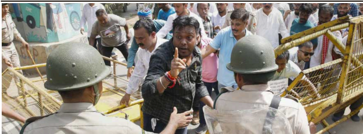
যুৱকৰ মৃত্যুৰ পিছতে ত্ৰিপুৰাৰ দক্ষিণ আগৰতলাত উত্তপ্ত পৰিস্থিতি

ই-সংবাদ, বেবেজীয়া, ১৭ অক্টোবৰঃ ৰাজ্যৰ বিভিন্ন প্ৰান্তৰ দৰেই নগাঁও জিলাত উলহ-মালহেৰে পালন কৰা হয় অসমীয়াৰ বাপতি সাহোন কাতি বিহু। জিলাখনৰ সৰ্বত্ৰে অসমীয়া জাতীয় সংস্কৃতি তথা বৰ্ণাঢ্য লোক পৰম্পৰাক সৰোগত কৰি উদযাপিত কৰে কৃষিজীৱি ৰাইজৰ অন্যতম লোক উৎসৱ। জিলাখনৰ পশ্চিম প্ৰান্তৰ ১২ খন গাঁৱৰ ৰাইজ একত্ৰিত হৈ পূৰ্ব পৰম্পৰাক সৰোগত কৰি উদযাপন কৰিলে কাতি বিহু। ঐক্য-সংহতিৰ উৎকৃষ্ট নিদৰ্শন দাঙি ধৰি গএগই বিগত বৰ্ষবোৰৰ দৰে এইবেলিও ঐতিহ্যমণ্ডিত শিঙিয়া দলনি সাৰ্বজনীন শ্ৰী শ্ৰী গোপাল কৃষ্ণ গৰখীয়া থানত উদযাপন কৰে কাতি বিহু। নসত্ৰ, কছৰাতলী, ৰাইদঙীয়া, মুকলি গাঁও, ভোগবাৰী, আলিচিগা, গাখজুৰা, আইভেটি, পছকটা আদি গাঁৱৰ ৰাইজৰ উপস্থিতিৰে একপ্ৰকাৰে উদুলি-মুদুলি পৰিবেশৰ সৃষ্টি হয় থান প্ৰাংগনত। গএগই পুৰাৰ ভাগত পতাকা উত্তোলন কৰাৰ পিছতে নাম-কীৰ্তনেৰে থান প্ৰাংগন মুখৰিত কৰি তোলাৰ অন্তত দুপৰীয়া ৰবাব টেঙা খোৱা পৰ্ব পালন কৰে। কাতি বিহুৰ চিৰাচৰিত পৰম্পৰা ৰক্ষা কৰি ধাননি পথাৰৰ দাঁতিত শিশু-যুৱক-যুৱতী আৰু বয়োজ্যেষ্ঠ সকলে মিলি ৰবাব টেঙা গুছাই হাঁহি-ধেমালীৰ মাজেৰে ৰবাব টেঙাৰ সোৱাদ লোৱাৰ লগতে পথাৰত চাকি-বস্তি জ্বলাই সকলোৰে মংগল কামনাৰে ঈশ্বৰৰ ওচৰত প্ৰাৰ্থনা জনাই। তদুপৰি কাতি বিহুৰ উছাহত বিলীন হৈ পৰা ৰাইজে নাচি-বাগি আনন্দ-স্বুৰ্তিত মছগুল হৈ পৰাৰ সমান্তৰালভাৱে সন্ধিয়া আকাশ বস্তি জ্বলাই কাতি বিহুৰ পৰম্পৰা ৰক্ষা কৰে। যাৰ পৰিণতিত ভোমোৰাগুৰি-নসত্ৰ সংযোগী পথৰ কাষত অৱস্থিত শিঙিয়া দলনিৰ গোপাল কৃষ্ণ গৰখীয়া থান অগণন পুৰুষ-মহিলা, শিশু, ডেকা-গাভৰুৰ উপস্থিতিৰে সমন্বয় ক্ষেত্ৰত পৰিণত হৈ পৰা দেখা যায়।